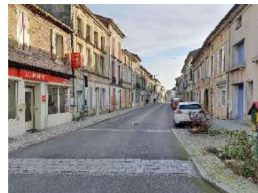
Analyse du tissu urbain notamment sous l'angle de la vacance des logements et des cellules commerciales