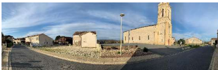
Analyse fonctionnelle et qualitative des espaces publics